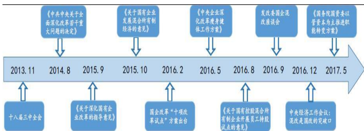
图标2：国企改革进程

上半年，国资委国企改革的效果已经显现，国资监管系统企业和中央企业收入效益实现了两位数的快速增长，国有企业营业总收入同比增16.6%，利润增24.3%，其中中央企业营业收入同比增长16.8%、利润总额同比增长15.8%，经济指标达到近年来最优。而这将提振国资委改革信心，在十九大召开之前，混改极有可能加快推进。